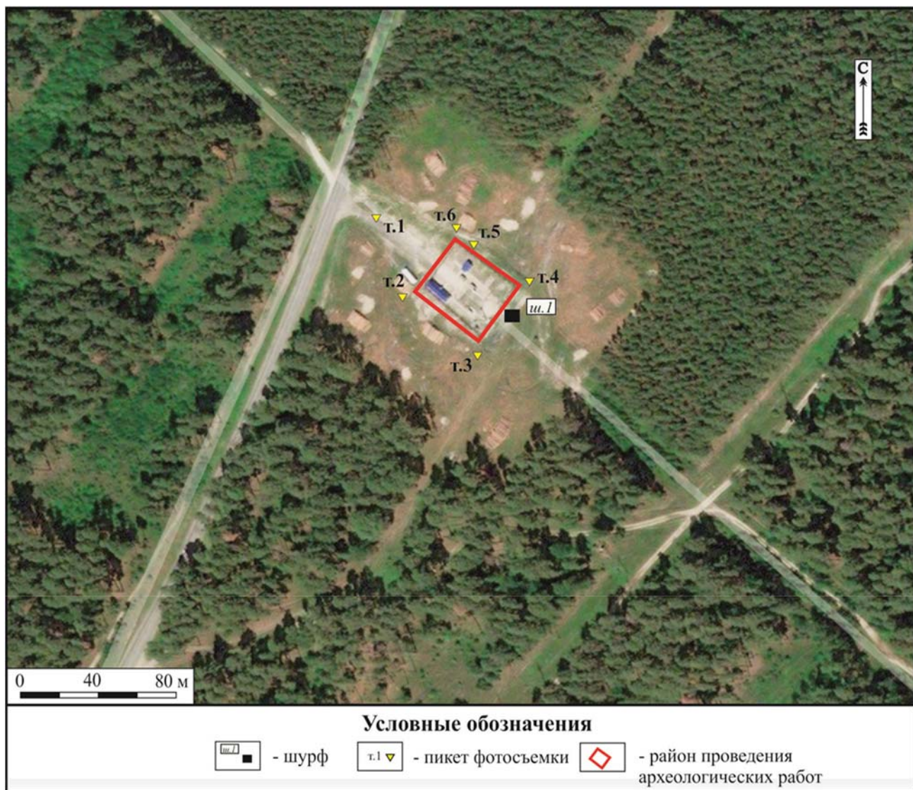
Илл.6. Пензенская область, Кузнецкий район. Земельный участок, отводимый под объект: «Газопровод-отвод к ГРС-53 п. Верховим (Комплексный капитальный ремонт ГРС с применением БЗГ), инв. №026488 (ПАО «Газпром») шифр 942.КР-20». Материалы общедоступной космосъемки. Места расположения шурфа и пикетов фотосъемки.