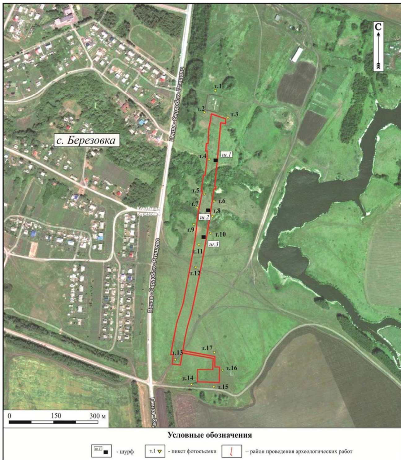
Илл.6. Пензенская область, Колышлейский район. Земельный участок, отводимый под объект: «Газопровод - отвод к с. Березовка (с/х "Березовский") и р.ц. Колышлей, L=22.968 км, инв.№ 21714, Ду159, 35 лет. Замена трубы 22,3 – 22,8 км». Мещерское ЛПУМГ. (Шифр 817.КР-19). Материалы общедоступной космосъемки. Места расположения шурфа и пикетов фотосъемки.