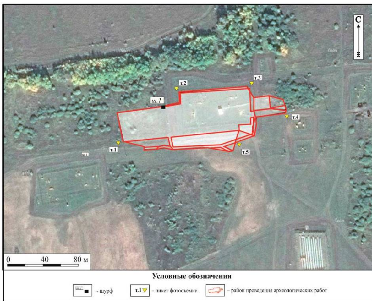
Илл. 8. Пензенская область, Сердобский район. Земельный участок, отводимый под объект: «Шлейфы с узлом подключения конденсатосборника КС Мещерское, инв. №139483. Комплексный ремонт технологических трубопроводов (узел подключения). Мещерское ЛПУМГ (шифр: 1071.001.015.250/909.КР-20)». Материалы общедоступной космосъемки. Места расположения шурфа и пикетов фотосъемки.