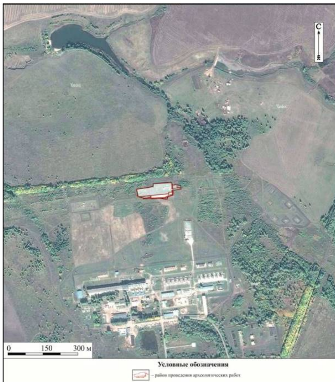
Илл. 7. Пензенская область, Сердобский район. Земельный участок, отводимый под объект: «Шлейфы с узлом подключения конденсатосборника КС Мещерское, инв. №139483. Комплексный ремонт технологических трубопроводов (узел подключения). Мещерское ЛПУМГ (шифр: 1071.001.015.250/909.КР-20)». Материалы общедоступной космосъемки.