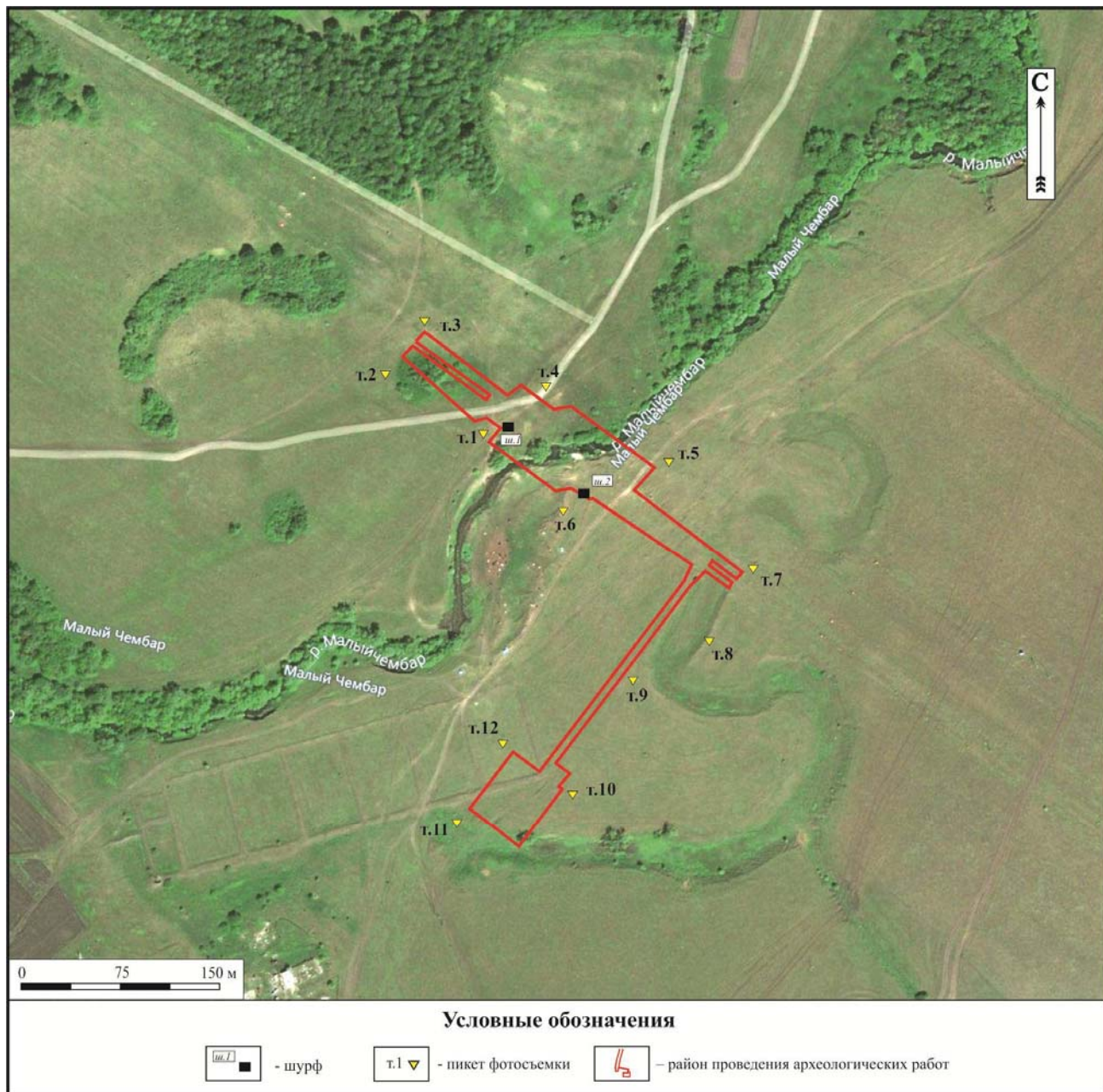
Илл.5. Пензенская область, Белинский район. Земельный участок, отводимый под объект: «Магистральный газопровод САЦ-1 (128.0 км от 1629-1757 км), инв. № 657, Ду 1020 мм, 52 года, 1646 км. Замена участка подводного перехода, р. М. Чембар, основная нитка» Башмаковское ЛПУМГ. (Шифр 826.КР-19). Материалы общедоступной космосъемки. Места расположения шурфа и пикетов фотосъемки.